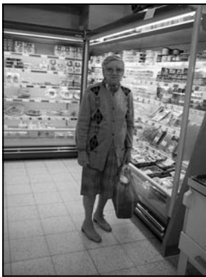
Cochet Rosa Dorpsstraat 160a 3078 Meerbeek

Uit een selectie van verschillende foto's zijn de volgende personen uitgekozen als afvalarme consumenten van de maand oktober: