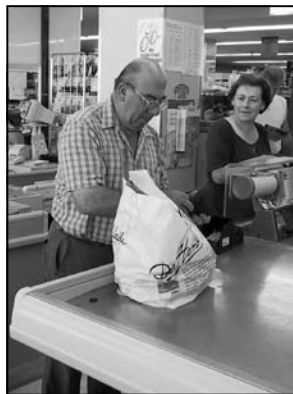
Hulstbergstraat 9 3078 Meerbeek

De uitgekozen consumenten mogen na publicatie een cadeaubon van de wereldwinkel ter waarde van € 10,00 komen afhalen op de Milieudienst, De Walsplein 30, 3070 Kortenberg.