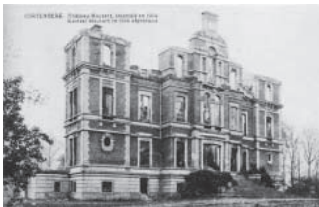
Het afgebrande kasteel van Houtart te Kortenberg in 1914. Dit kasteel werd na de oorlog niet heropgebouwd. Het domein werd verkaveld en de Parkstraat werd erdoor getrokken