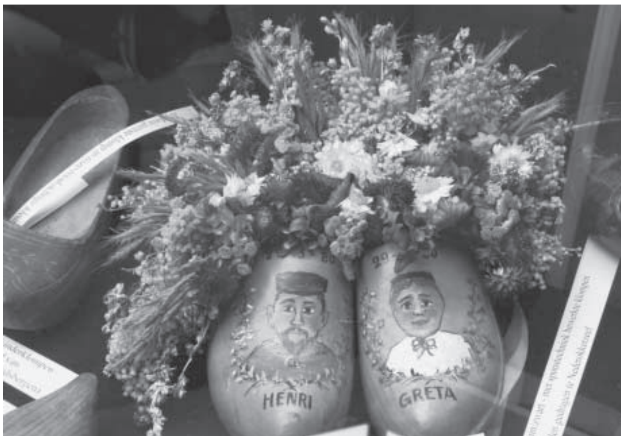
Deze foto werd op de open monumentendag genomen door Willy Trappeniers...

Meer info kan u krijgen bij: Gerd Van Kogelenberg 016/48 11 91 info@vzwborstvoeding.be